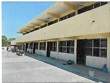
F3: Fachada posterior